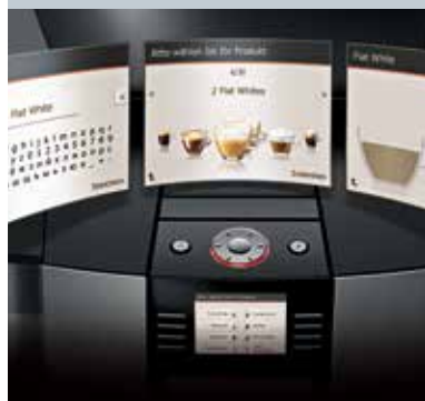
Individuell programmierbarer Start-Bildschirm