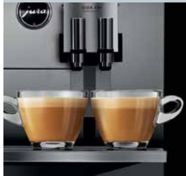
Variabler Kombiauslauf mit 2 Kaffee- und 2 Milchausläufen