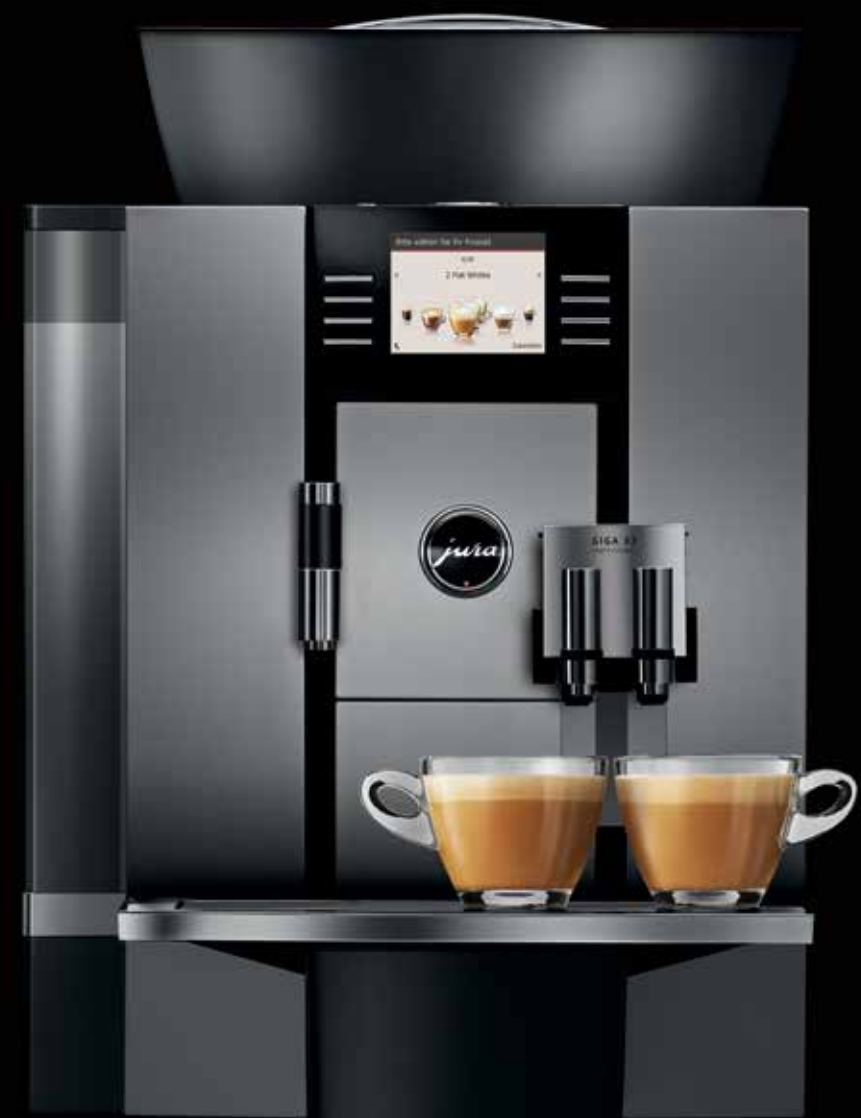
GIGA X3 Professional

Dank einer breiten Palette von Zubehörartikeln wie Tassenwärmer, Milchkühler, Kaffeesatzabwurf-Set, Restwasserablauf-Set und Schnittstelle für Abrechnungssysteme sowie einem attraktiven Möbelsortiment lässt sich für jedes Einsatzgebiet eine optimale, an die individuellen Bedürfnisse angepasste Kaffee-Gesamtlösung zusammenstellen.