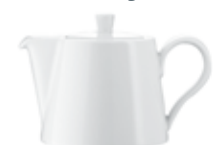
Kaffee im Kännchen (360 ml) 2 Min. 33 Sek.